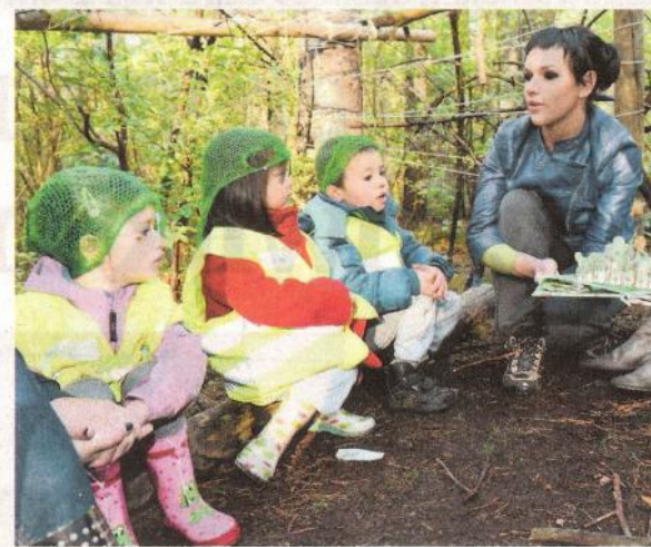
Studenten laten kleuters het rijke bosleven ontdekken.