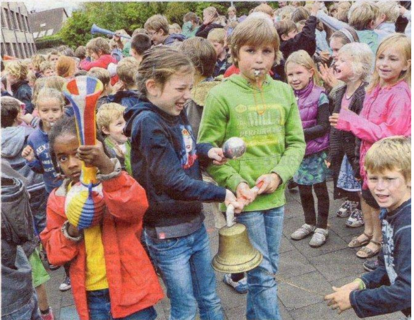
Niets zo leuk als lawaai maken voor het goede doel.